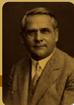
Moritz Schlick (1882-1936)