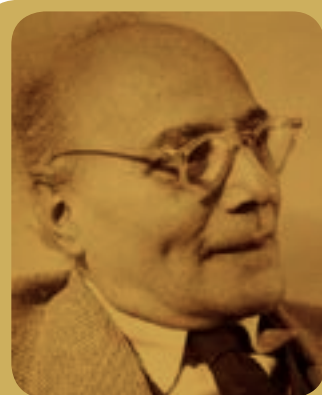
Karl Polanyi (1886-1964)

La multidisciplinariedad también se presenta en grupos, por ejemplo dice Burke, en Budapest se crea el Circulo Galilei, que era una asociación de estudiantes progresistas cuyos miembros serían personas influyentes en la Hungría soviética, su primer presidente fue Karl Polanyi (1886-1964), hermano de Michael Polanyi, al que se hizo referencia anteriormente. En el siglo XX, Moritz Schlick forma el Círculo de Viena (1929-1936); también se puede incluir al Club de la Historia de Baltimore, en dónde historiadores conversaban con especialistas en literatura.