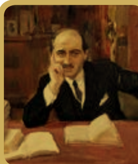
José Ortega y Gasset (1883-1955)