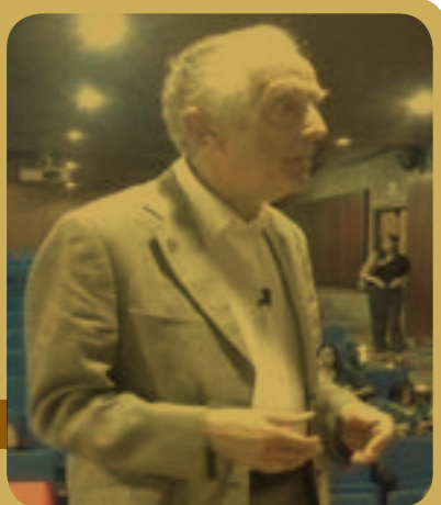
Peter Burke (1937)

Peter Burke [1], reconocido investigador de la historia cultural moderna, estuvo en Medellín - Colombia para su condecoración como Profesor Honorífico por parte de la Universidad Nacional, Facultad de Ciencias Humanas y Económicas, durante su estancia impartió el Seminario “Historia del conocimiento”; además conversó muy amablemente para esta Revista sobre multidisciplinariedad, interdisciplinariedad y especialización [2].