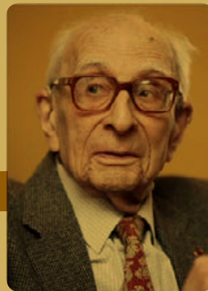
Claude Lévi-Strauss (1908-2009)