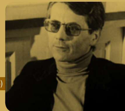
Michel de Certeau (1925-1986)

También hace mención del químico y filósofo Michael Polanyi (1891-1976), subrayando que llevó a cabo investigaciones en fisicoquímica, economía y filosofía. A esta lista agrega al profesor Jared Diamond (1937), fisiólogo evolucionista, profesor de la Universidad de California que ha hecho aportes importantes a la historia, acercando el conocimiento de la ecología, la antropología y la lingüística. Comenta Burke que Diamond se ha pasado del Departamento de fisiología al de geografía, y se pregunta, si un erudito de este tipo está emergiendo; se queda pensando y añade “Diamond ya pasa de los 78 años”.