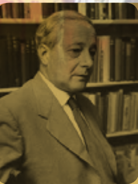
Michael Polanyi (1891-1976)