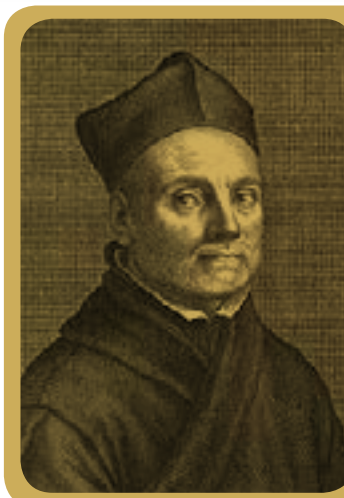
Atanasio Kircher (1602-1680)