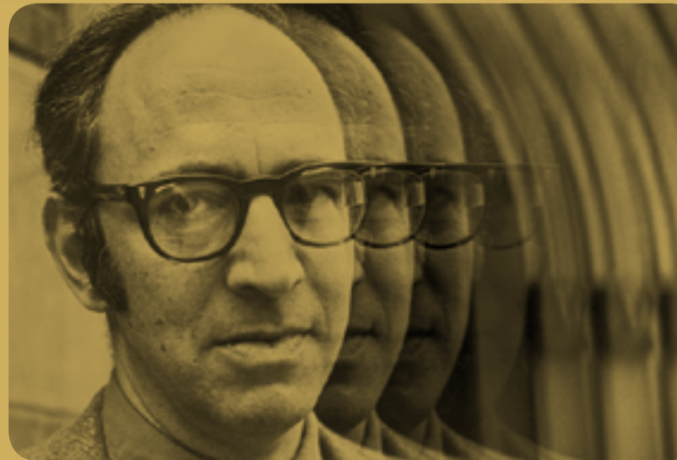
Thomas Kuhn (1922-1996)

y americanas, ¿Por qué se institucionaliza? porque fue considerada el medio adecuado para la formación de los empleados del Estado, en el contexto de la colonización, la lucha por África.