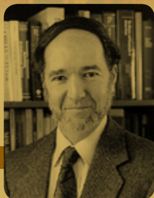
Jared Diamond (1937)

Bristol, que comprendían desde la física hasta la historia. Comenta, a menudo se ilumina un objeto de estudio observando al opuesto.