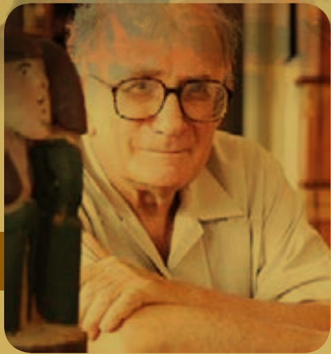
Fernand Braudel (1902- 1985)

Dice Burke, sé de algunos estudios que estando establecidos en deportes, por razones diferentes se han abierto a estudios más comparativos, religiosos, económicos. También de algunos departamentos de historia del arte que se han transformado en estudios urbanos, políticos, de traducción; estudios de la mujer, de lesbianas, gay, latinos; ciencias de la tierra, de la vida no solo biología, ni solo medicina, no solo salud, también estudios ambientales.