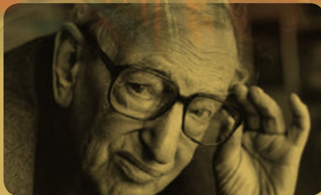
Eric Hobsbawm (1917-2012)