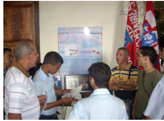
Vista de la expo del Centro de Biofísica Médica

Se estableció en el segundo piso del Centro de Información y Gestión Tecnológica [MEGACEN] y desde su inauguración se han presentado ocho exposiciones [[Resultados del Centro de Biofísica Médica, Aplicación del electromagnetismo a la salud, la agricultura y la industria [Centro Nacional de Electromagnetismo Aplicado]], La Sismología y la Meteorología al servicio de la sociedad, 50 años de la Universidad de Ciencias Médicas, entre otros.