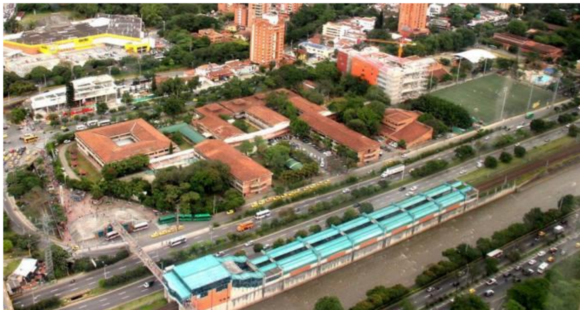
Imagen 1. Vista aérea de la Sede Central (El Poblado)

Toma Aérea del Politécnico Colombiano Jaime Isaza Cadavid Sede Central (El Poblado). (2017). La Sede Central (El Poblado), fundada en marzo de 1964, está ubicada en la Carrera 48 # 7 – 151 El Poblado, Medellín.