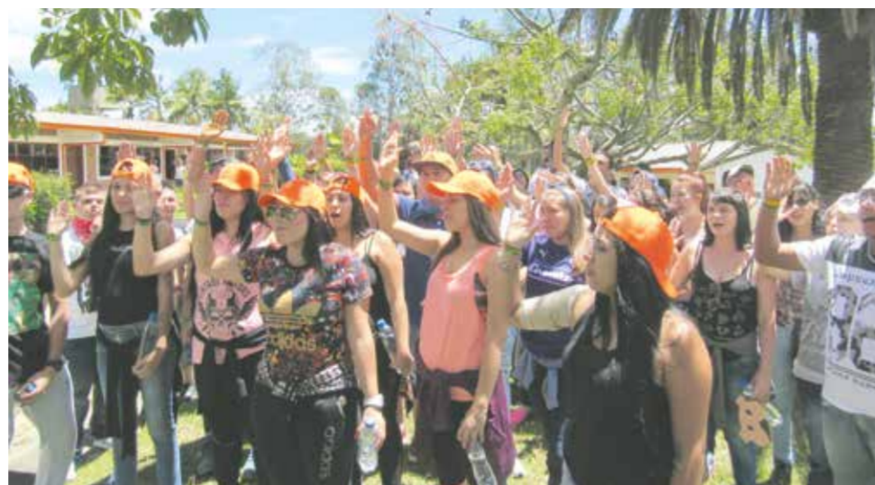
Estudiantes de la Tecnología de Organización de Eventos hicieron la promesa formal de trabajar en la ruta de la Acreditación Institucional.

de la Tecnología en Organización de Eventos se comprometan con la meta de la acreditación del programa, y, lo más importante, comiencen a crear conciencia sobre la responsabilidad que se debe sostener en el tiempo al lograrla; de ahí que el lema de esta campaña sea “Acreditación TOE, por siempre”. Los estudiantes y graduados serán los principales beneficiarios de este proceso de Acreditación en Alta Calidad, dado que ganarán alto reconocimiento en el sector de las comunicaciones, y se podrá asumir este logro como un medio para mostrar los resultados del trabajo educativo que se realiza desde la Institución.