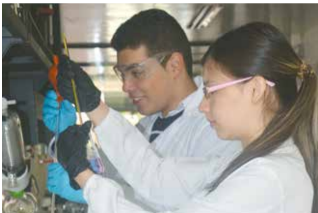
Centro de Laboratorios Bello