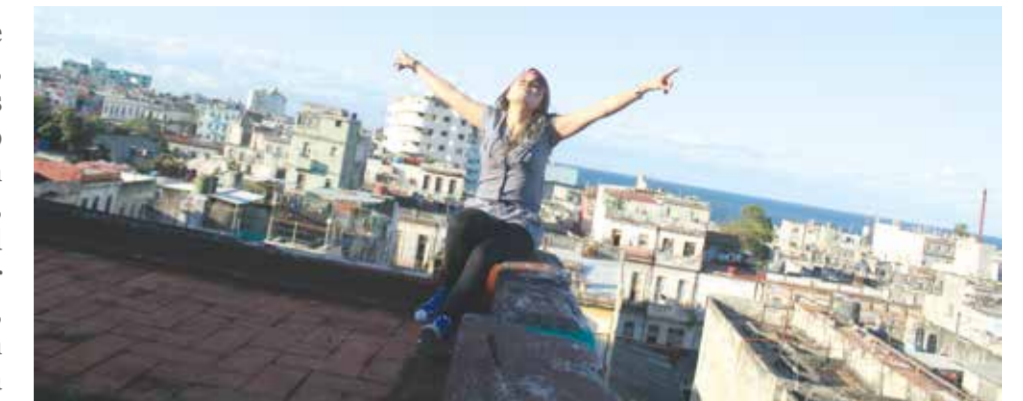
Fotografía tomada por Paula Andrea Tobón Echavarría, Comunicadora Audiovisual del Politécnico Colombiano Jaime Isaza Cadavid. Realizó un curso de Cine Documental de Creación, en la Escuela Internacional de Cine y Televisión, situada en San Antonio de los Baños, Cuba.

La Dirección de Cooperación Nacional e Internacional es una oficina abierta a la comunidad del Politécnico Colombiano Jaime Isaza Cadavid, para el servicio de estudiantes, docentes y personal de las seis facultades, en el proceso de internacionalización y de cooperación con entidades aliadas que estamos desarrollando en la Institución.