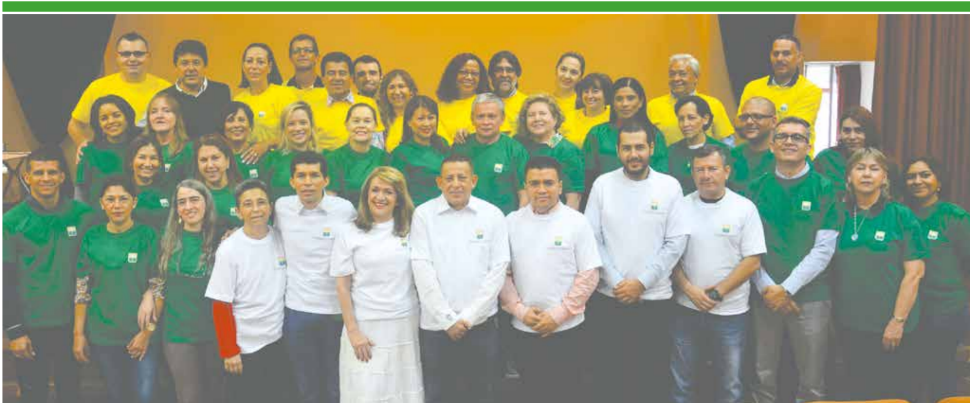
Estos son los equipos de autoevaluación de los diferentes programas académicos de la Institución, que tiene la tarea de revisar minuciosamente cada uno de los procesos que inciden en la calidad de la educación, en la ruta de la Acreditación Institucional.

en la pertinencia y aporte a la solución de problemáticas propias de la región, el departamento y el país, además del incremento en la demanda de los programas diseñados desde esta óptica.