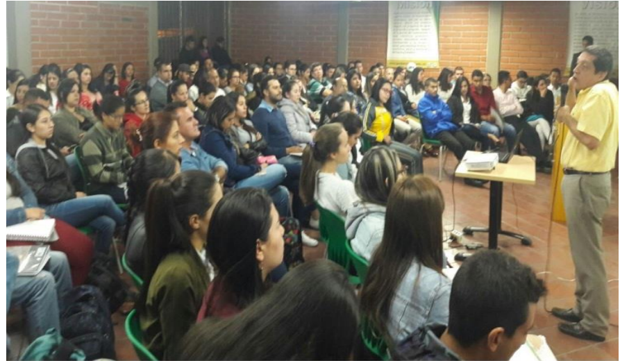
Commemoración 24 años del programa de Contaduría Pública. Sede Rionegro

En los 25 años del programa académico de Contaduría Pública, el Politécnico Colombiano le han brindado a la comunidad antioqueña y nacional cerca de 5.000 graduados en la profesión contable, los cuales participan activamente en las diferentes organizaciones tanto privadas como públicas, lo que conlleva a un alto reconocimiento a nivel nacional del programa académico y una trayectoria que ha permitido alcanzar un nivel de madurez del programa que genera gran confianza para garantizar la formación integral de un Contador.