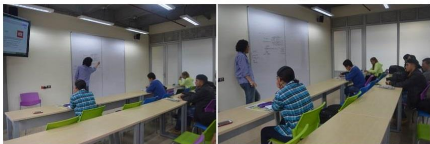
Capacitación brindada por la Emisora Cultural de la UdeA en la Facultad de Comunicación Audiovisual del Politécnico Colombiano Jaime Isaza Cadavid

Con cooperación de la Emisora Cultural de la Universidad de Antioquia, hemos preparado a un grupo de profesores y alumnos que están listos para transmitir una nutrida e incluyente programación en la emisora Radio Poli.