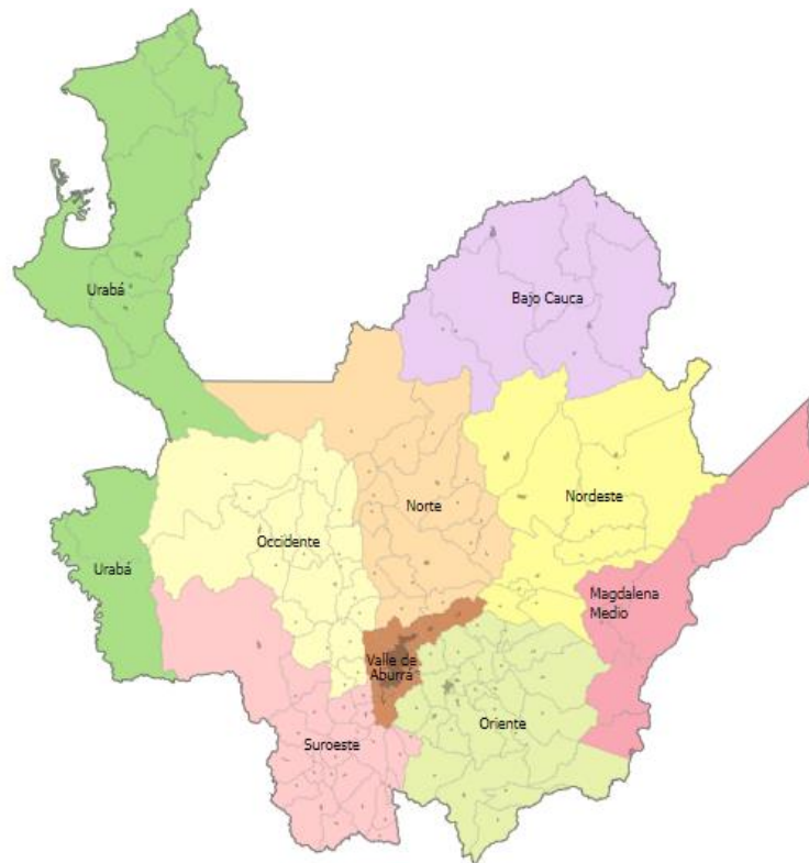
Figura 2. Regiones Departamento de Antioquia.

Fortalecer la generación, producción, gestión y transferencia de conocimientos que contribuyan al desarrollo de la Investigación Aplicada en la institución y su impacto en las regiones del Departamento de Antioquia, así como la retroalimentación de la actividad investigativa en la docencia y la extensión institucional.