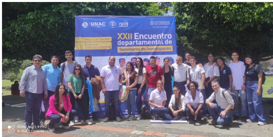
Figura 1. Semilleros de investigación de las sedes de Rionegro y Apartadó – RedColsi departamental 2023.

El Politécnico Colombiano Jaime Isaza Cadavid dentro de su plan de desarrollo, propende por fortalecer el eje misional estratégico de investigación, mediante la Política de Ciencia, Tecnología e Innovación, alineada a los Objetivos de Desarrollo Sostenible 1 (ODS), y la consolidación de los semilleros de investigación institucional.