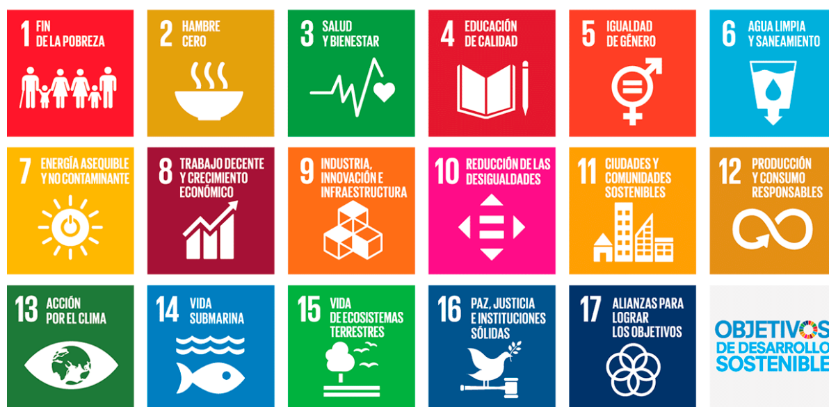
Figura 1. Objetivos de Desarrollo Sostenible – Agenda 2030

Esta convocatoria busca contribuir institucionalmente con la ejecución de los Objetivos de Desarrollo Sostenible (ODS), buscando aumentar el nivel de cohesión social y promoviendo condiciones de desarrollo económico, desarrollo social incluyente y responsable con el medio ambiente en el departamento de Antioquia y la nación.