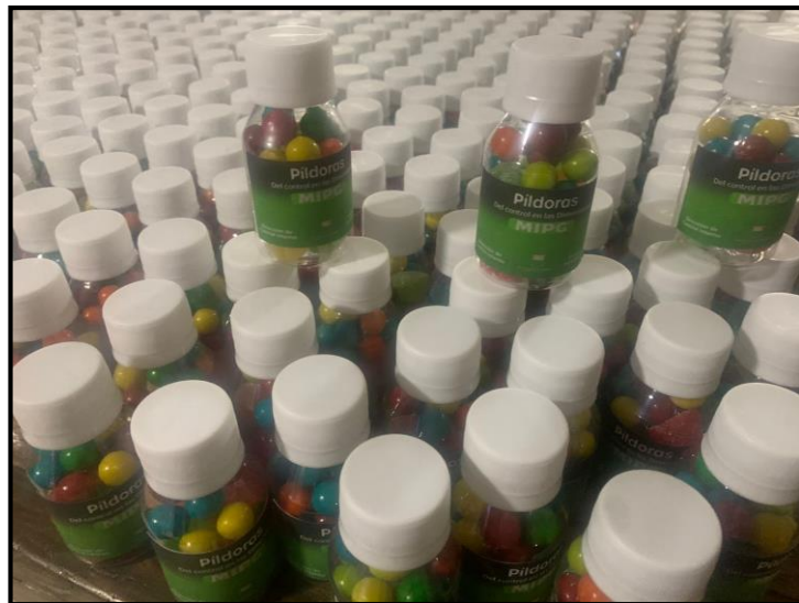
Entrega de suvenires de píldoras de MIPG