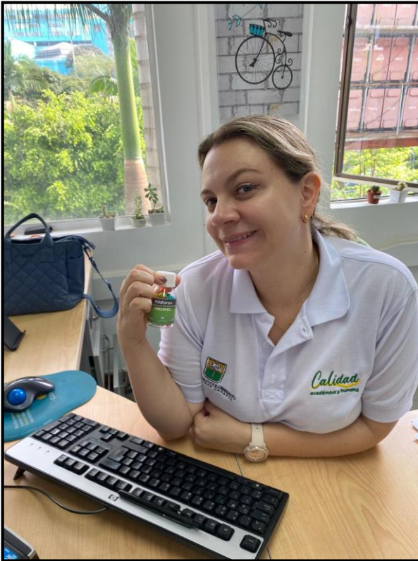
Entrega de suvenires de píldoras de MIPG