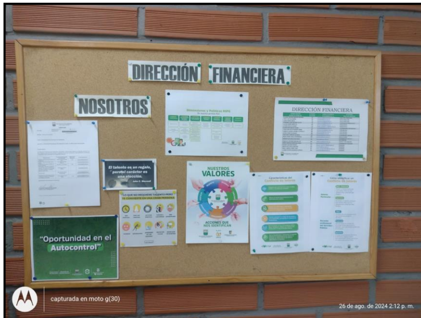
Publicación de información en cartelera de la Institución